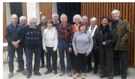
Membres du Relais Isère lors de l'AG