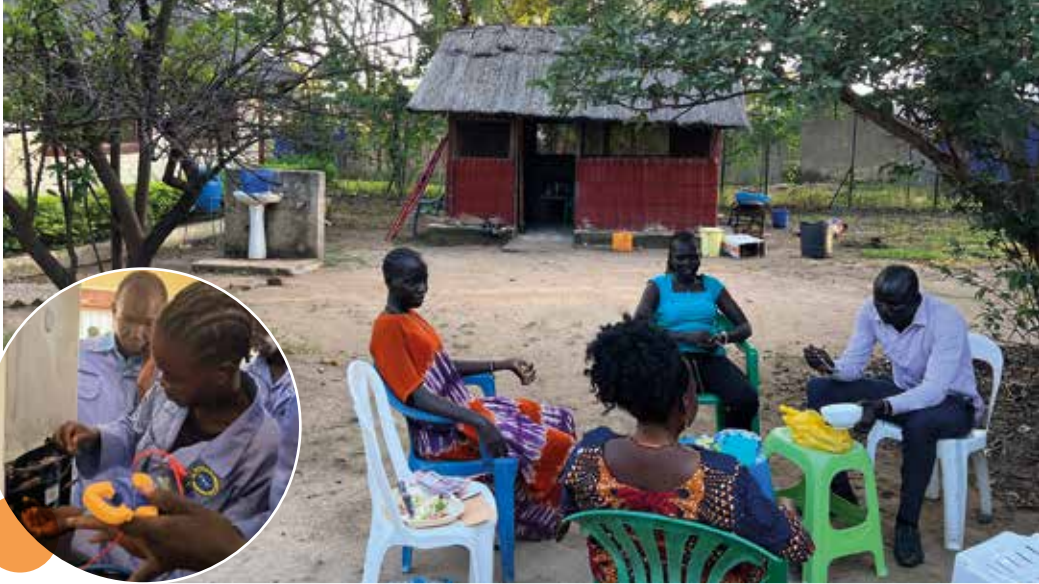
Jeunes en formation réfrigération

Aucun problème important n'a été signalé suite à la présence de ces jeunes au sein des formations. Les habitants de Lologo sont même très satisfaits car cela a permis d'améliorer la sécurité dans le bidonville.