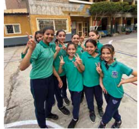
Ecole Gabal El Mokattam octobre 2024

est vraiment de mise dans cette école. Les résultats le montrent bien. J'ai pu observer que les enfants dont les familles sont les plus démunies, peuvent avoir un repas gratuit le midi. Des sandwichs ou un plat chaud de pâtes ou autre. Les enfants ont un ticket contre un repas pour le midi, personne ne sait si ce ticket a été payé ou donné gratuitement par Sœur Nada.