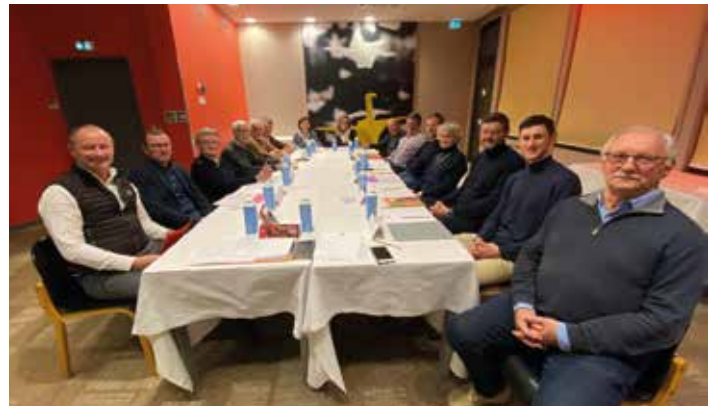
Les membres de club Yalla

Les fonds collectés sont versés directement sur un compte bancaire spécifique libellé « OPÉRATION ORANGE – YALLA ! LE CLUB » ; puis virés avec l'objet de leur emploi à « Opération Orange de sœur Emmanuelle, National » seule habilitée à délivrer des reçus fiscaux.