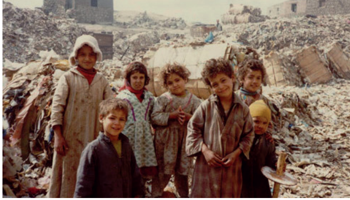
Les enfants dans les ordures

Au printemps 1974 ma collègue Directrice du Lycée Notre Dame de Sion à Grenoble m'apprenait qu'une sœur de sa congrégation vivait dans un bidonville du Caire avec les chiffonniers – les ramasseurs d'ordures de cette mégalopole. J'eus du mal à la croire. Comme au printemps j'accompagnais un voyage en Égypte, je laissais, le 5 mai, mon groupe dans le musée du Caire et, non sans mal, je trouvais un taxi pour m'emmener. Il m'arrêta au bout d'une route, avant une piste impraticable pour une voiture et je continuais à pied.