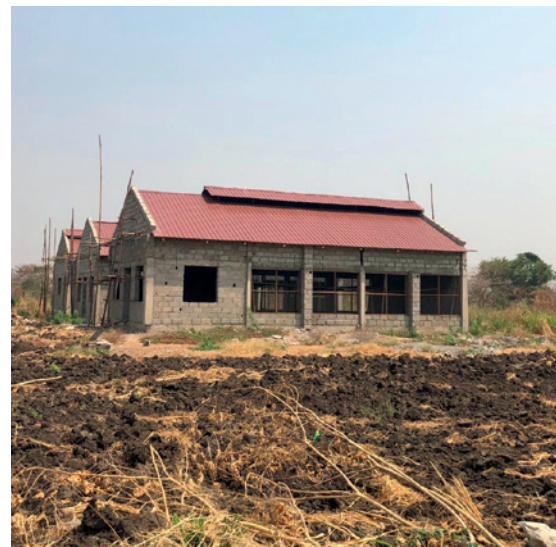
Construction des bâtiments pour la production avicole

Le projet est enfin conçu comme un PGR (programme générateur de revenus) avec couverture d'une partie des frais de fonctionnement du Centre de Soins qui est actuellement financièrement très dépendant de l'aide internationale. Ceci permettra aussi, selon le souhait du gouvernement sud-soudanais, qui rémunère le personnel médical, d'augmenter son activité en ouvrant le Centre de Soins aux populations de villages voisins.