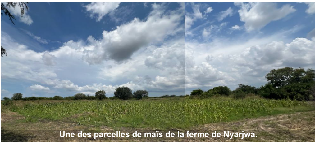
Une des parcelles de maïs de la ferme de Nyarjwa.