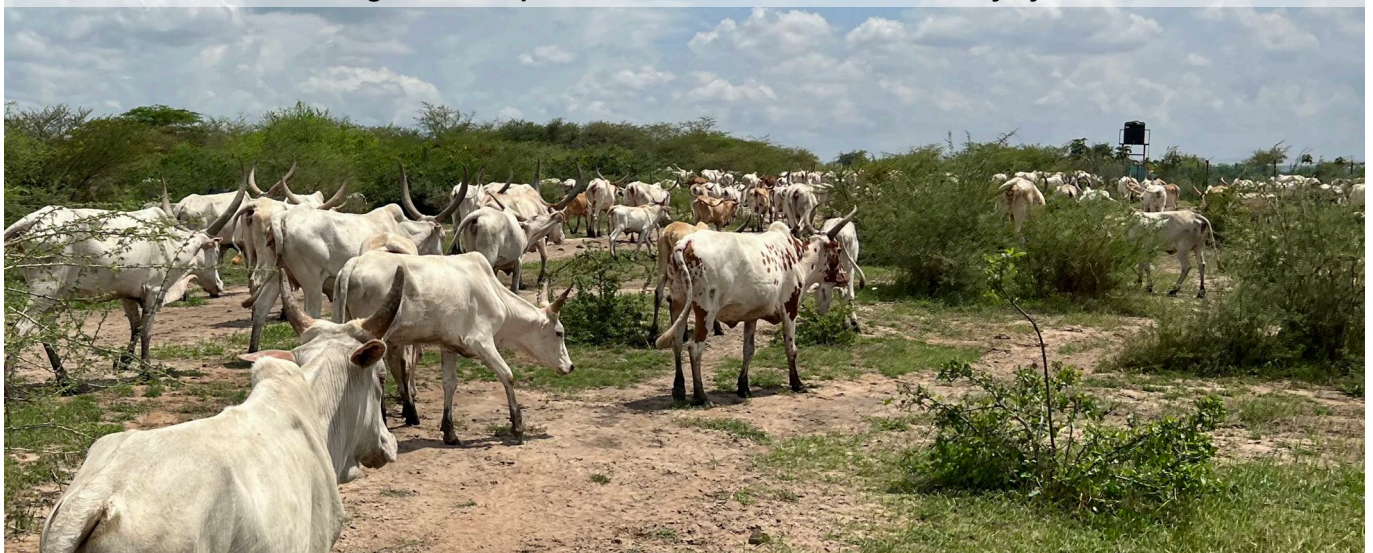
Passage d'un troupeau devant l'entrée de la ferme de Nyarjwa