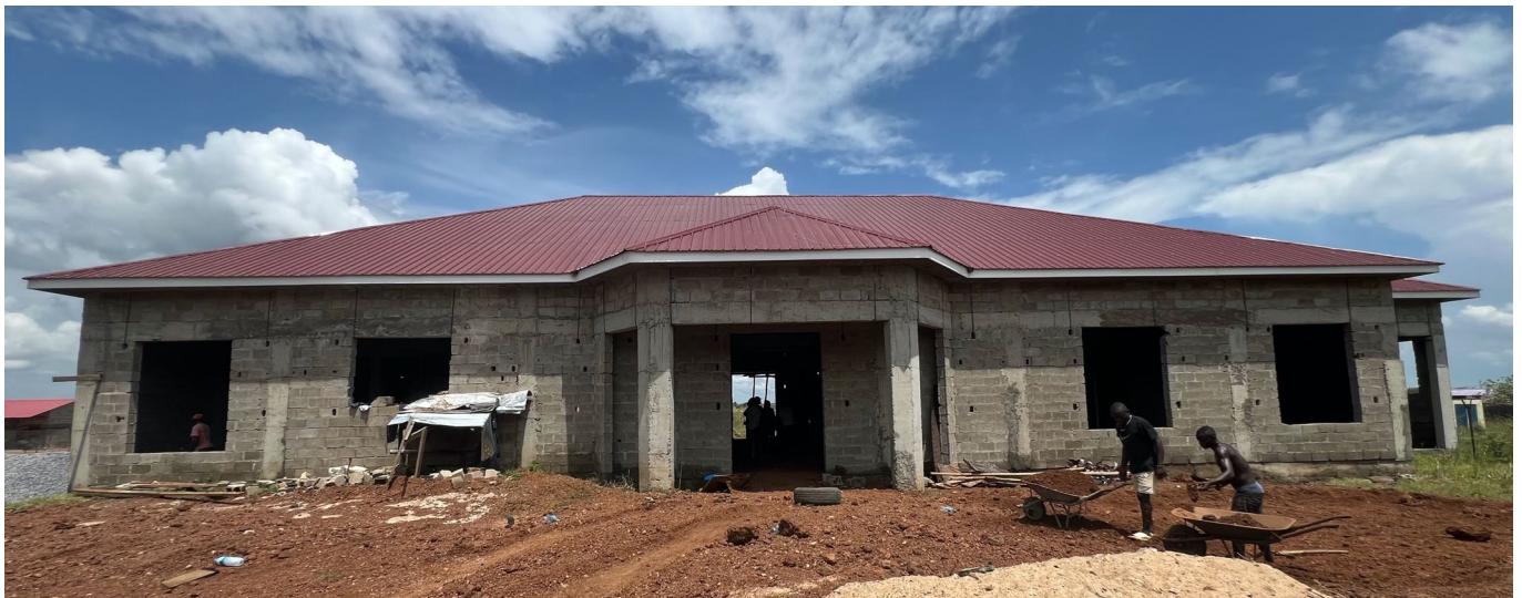
Le hall communautaire de Nyarjwa

Le système installé par BBM est pratique parce qu'extensible : l'année prochaine, SVDP aimerait trouver de quoi financer son extension pour les ateliers de formation (sauf soudure), l'unité avicole, et les bureaux.