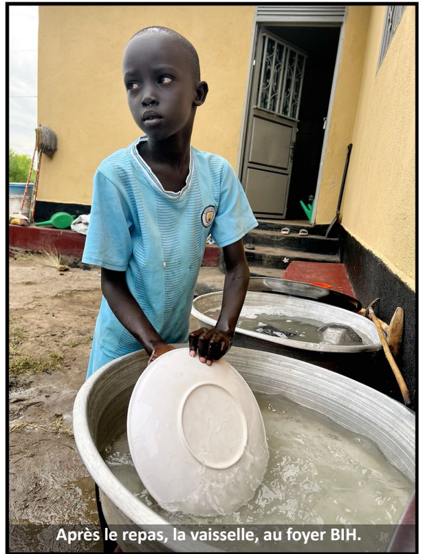
Après le repas, la vaisselle, au foyer BIH.