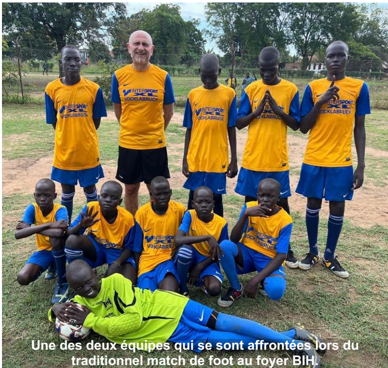
Une des deux équipes qui se sont affrontées lors du traditionnel match de foot au foyer BIH.