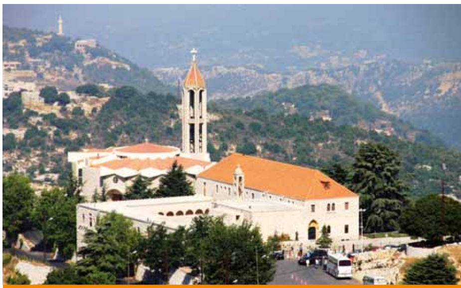
COUVENT SAINT CHARBEL - AANAYA