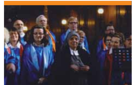
CATHÉDRALE DE NANCY SŒUR SARA ET LE GROUPE GOSPEL MISSISSIPPI

Un grand merci à Mourad, intervenant précieux pour toutes les questions relatives à la politique et l'économie de l'Égypte, et à tous ceux qui préparent les interventions, au