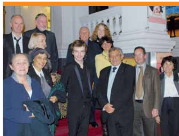
À L'OPÉRA-THÉÂTRE D'AVIGNON