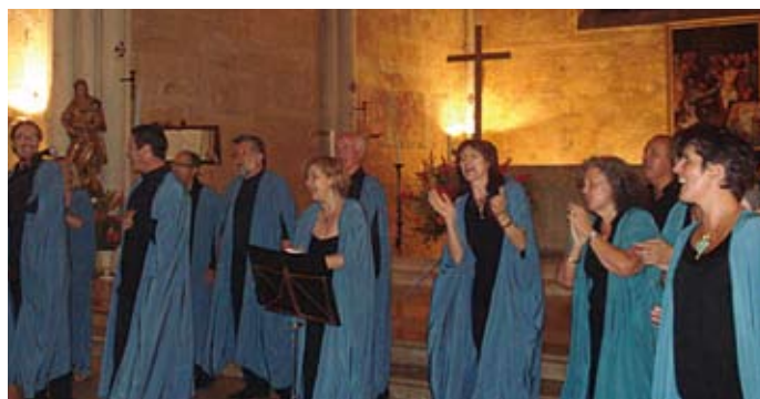
THE GOOD BOUILL' GOSPELERS