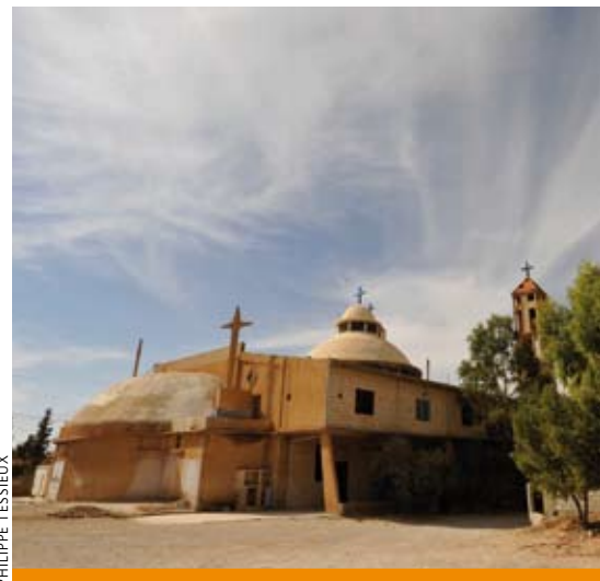
ÉGLISE DE LA PAROISSE DU PÈRE LIANE À AL QAA AU NORD DU LIBAN, PRÈS DE LA FRONTIÈRE SYRIENNE.