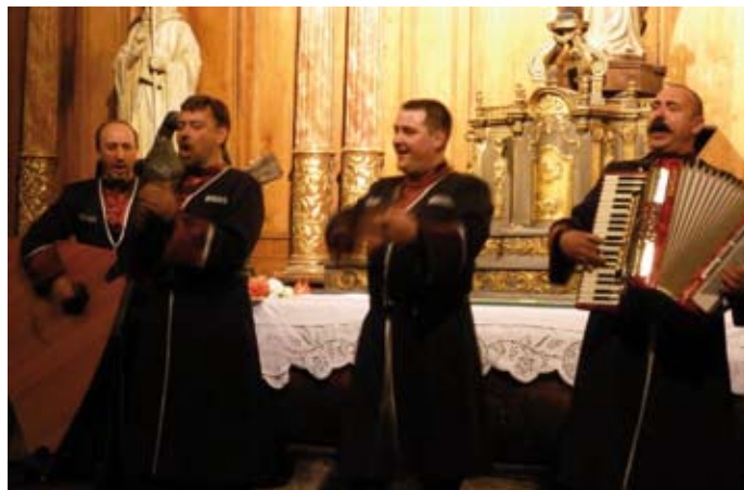
CONCERT DONNÉ PAR L'ENSEMBLE COSAQUE Kouban