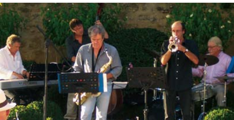
JAZZ APÉRO BAND